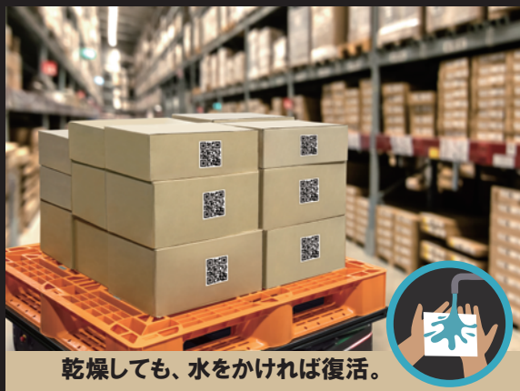
乾燥しても、水をかければ復活。

アルコール系ウェットシートは乾燥時に除菌効果が気化して効力を失います。それに対し「あるプロ」は銅ナノイオンを採用しているため効力は滞留し、再度水で潤いを与えれば効力が復活します。災害対策用の備蓄品としての活用にも最適です。